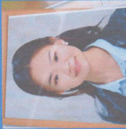
Кан Жанно ПРЕСС-СЛУЖБА