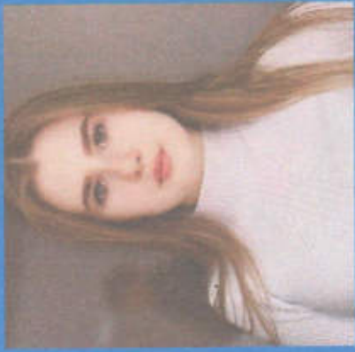
Аксеценко Полина МИНИСТР ЮСТИЦИИ