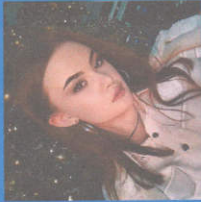
Сергеева Валерия МИНИСТР ИННОВАЦИОННЫХ ТЕХНОЛОГИЙ