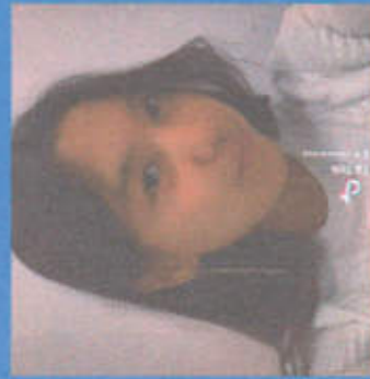
Акбарова Ырысайым МИНИСТРЫ КУЛЬТУРЫ