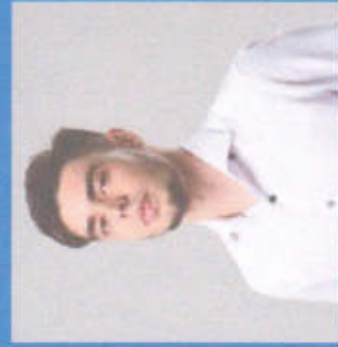
Ахмад Тумуршах Халиг МИНИСТРЫ ЗДРАВООХРАНЕНИЯ И СПОРТА