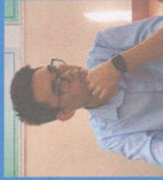
Джунушев Асхат МИНИСТР ОБРАЗОВАНИЯ