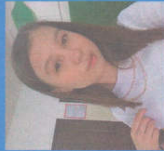
Орозбаева Чолпон МИНИСТРЫ КУЛЬТУРЫ