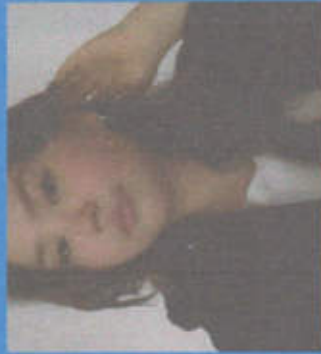
Сапаркулова Мориям ВИЦЕ-ПРЕЗИДЕНТ