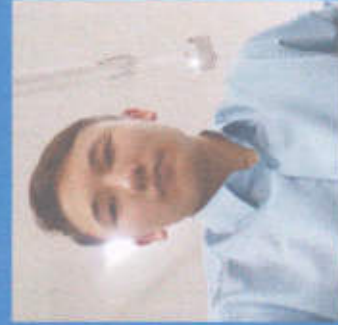
Эрнесов Нурмат МИНИСТРЫ ЗДРАВООХРАНЕНИЯ И СПОРТА